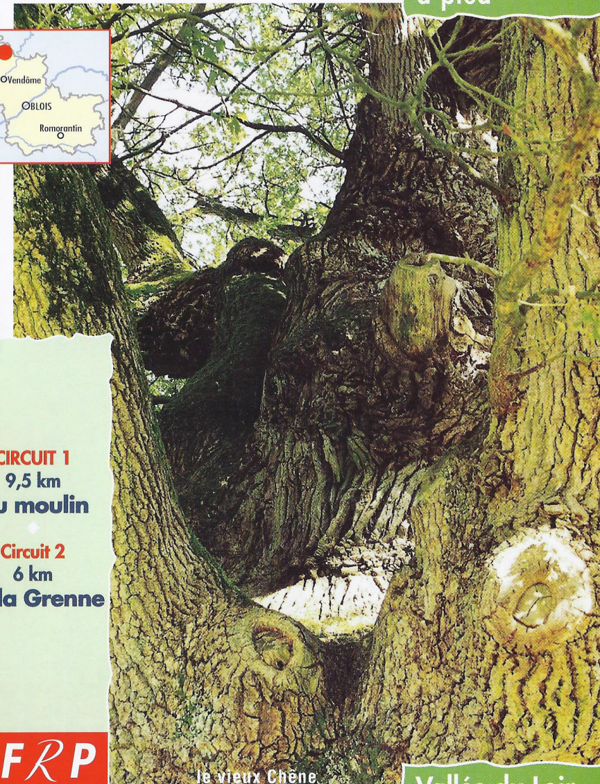
le vieux Chêne

Comité Départemental de la Randonnée Pédestre